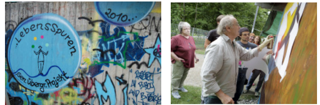
Generationsübergreifendes Graffiti - Kunstprojekt

größte Nachfrage gibt es bei Sport-, Sprach- und Kulturangeboten.