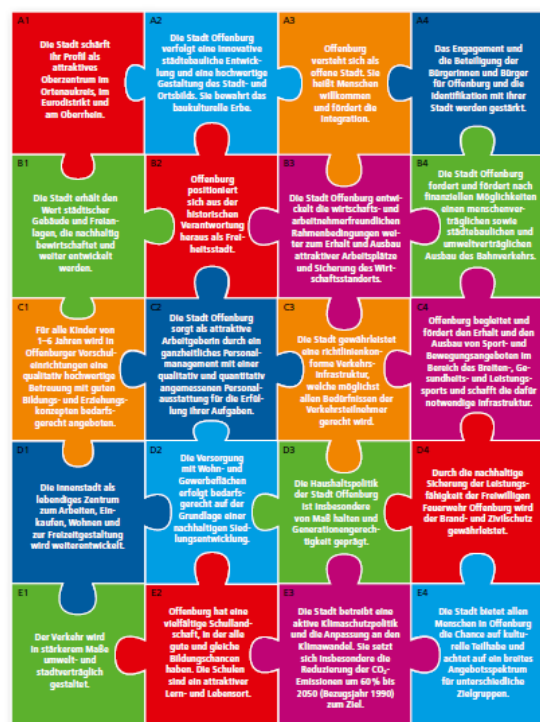
Strategische Ziele der Stadt Offenburg – Haushalt 2016/17

Der Gemeinderat traf sich im Oktober 2015 zu einer Gemeinderatsklausur zum Thema Strategische Ziele. Gemeinsam wurden zwischen Gemeinderat und Stadtverwaltung 20 neue Ziele erarbeitet sowie modifiziert und anschließend vom Büro der Oberbürgermeisterin in ein Schaubild aufgenommen.