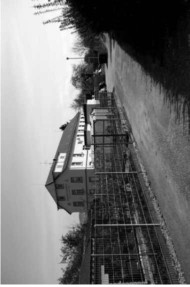
→ Vis. 4 (S. 67)