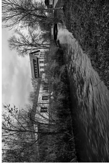
→ Vis. 5 (S. 68)