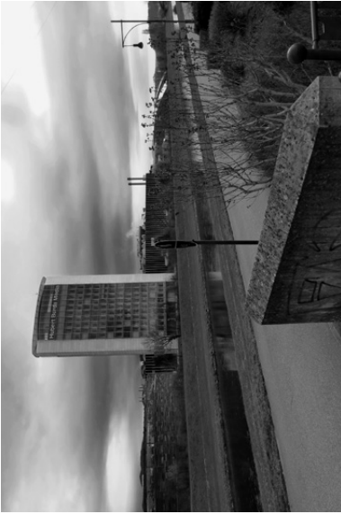
→ Vis. 1 (S. 50/51)