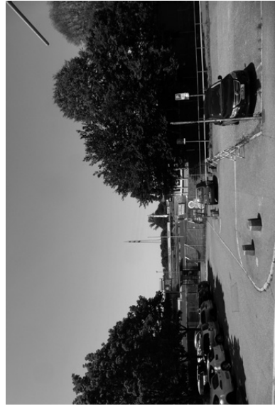
→ Vis. 3 (S. 66)