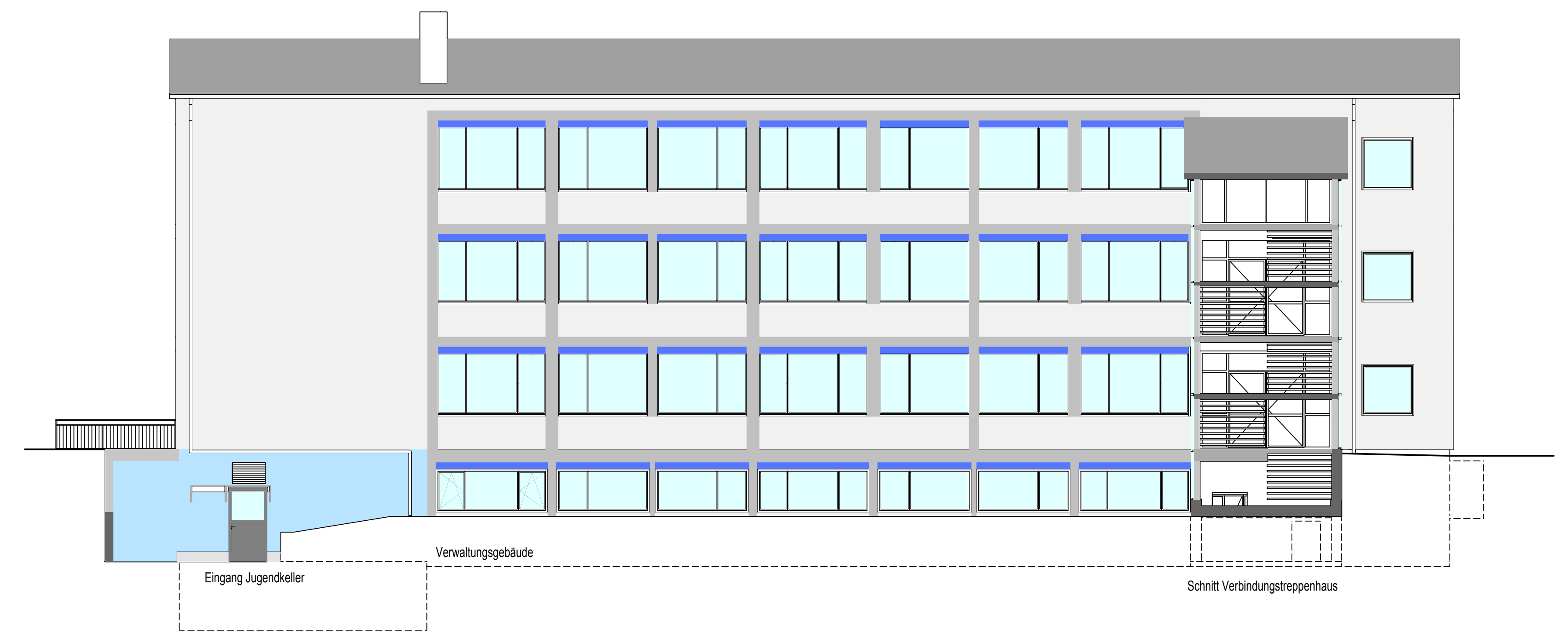
Ansicht von Süden - Verwaltung Geb.119