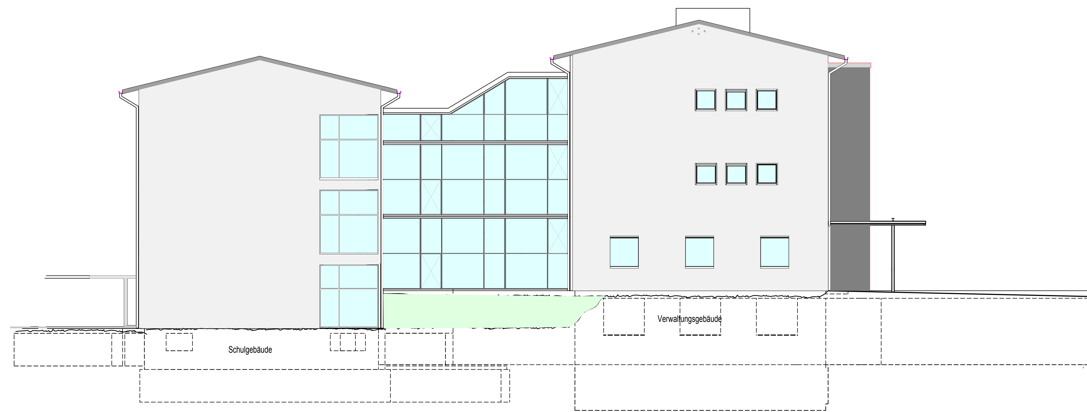
Ansicht von Osten - Schule Geb.120