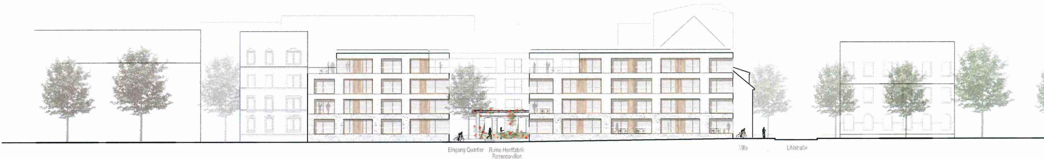
Ansicht Franz-Volk-Straße 1:200