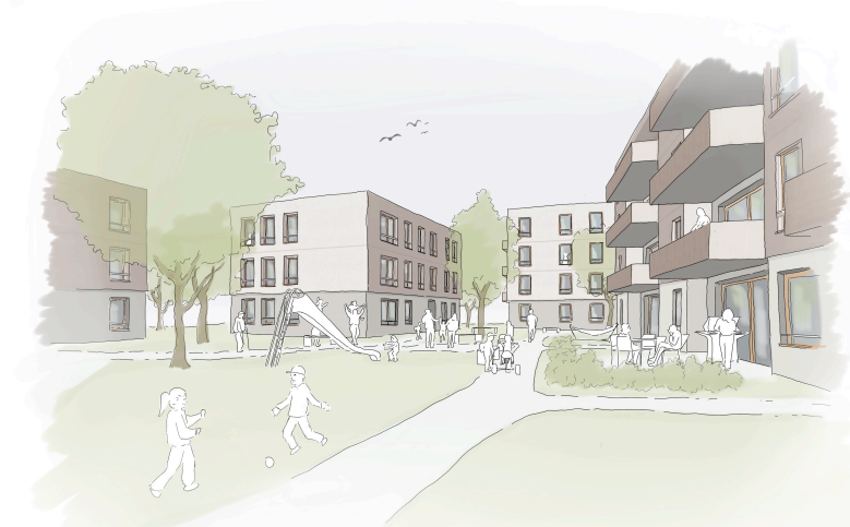
Perspektive Innenhof (pörrlicher Bereich)