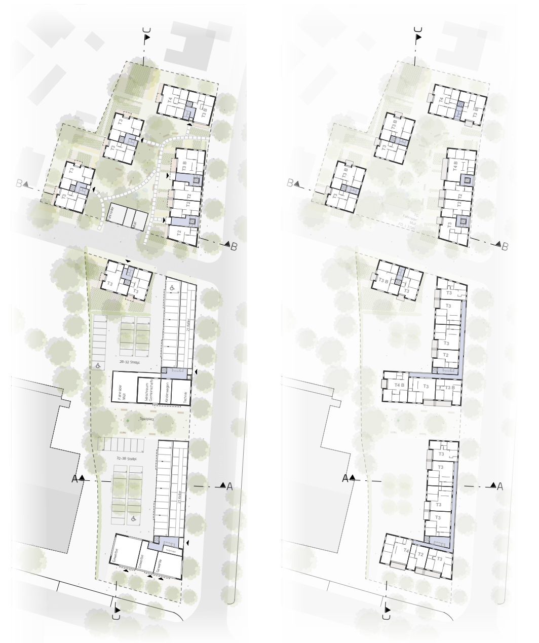
Grundriss Erdgeschoss M_1500