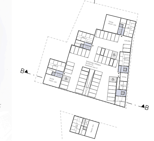
Grundriss Untergeschoss M_1500