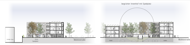
Querschnitt durch den südlichen Teil (Schritt A-A) M_1500