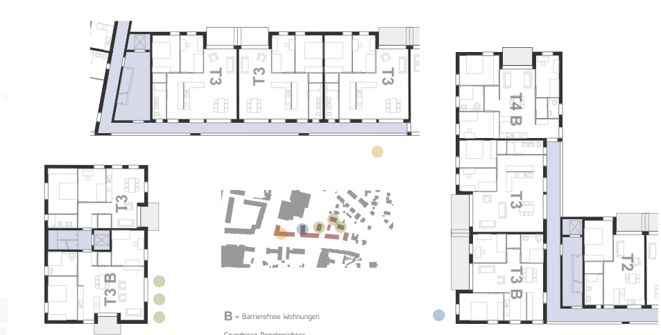
Grundrisse Regelgeschoss M_1200