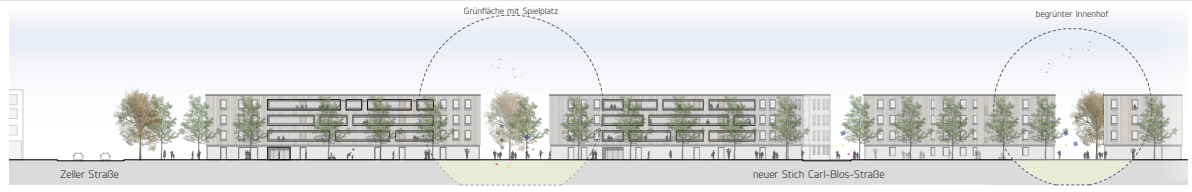
Ansicht Moltkestraße M_1500