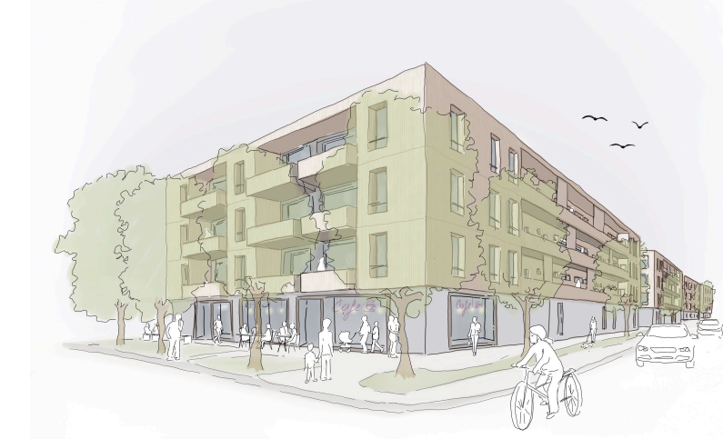
Perspektive Moltkestraße / Zeller-Straße