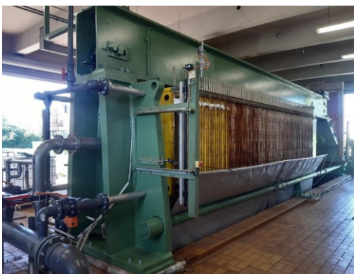
AZV: Sanierung Kammerfilterpresse