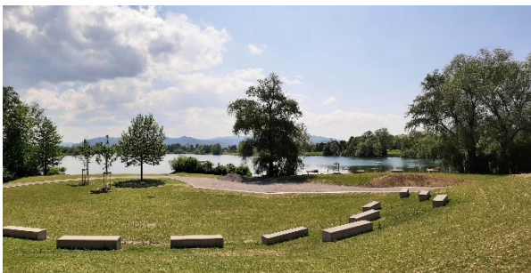
Umgestaltung Halbinsel Gifz