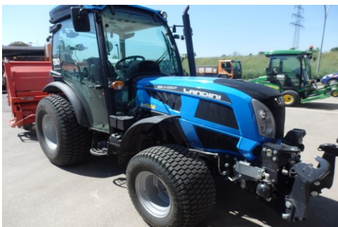
TBO: Beschaffung eines Sportplatzschleppers