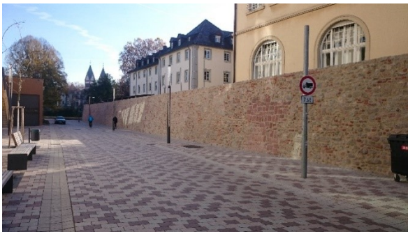
Sanierung der Stadtmauer