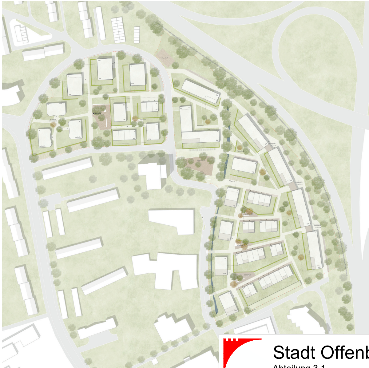
LAGEPLAN M 1:500