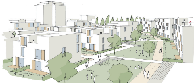
BLICK IN DEN ANGER