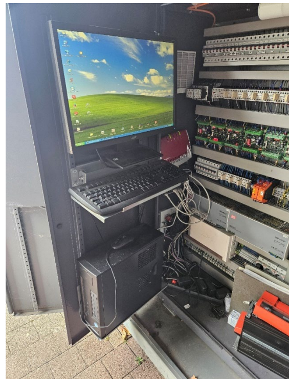
Schaltanlage und Steuerungs-PC