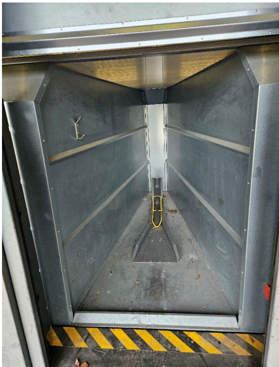
Radbox innen mit Sicherheitsbügel