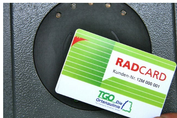
RFID-Karte + -Kartenleser zur Öffnung