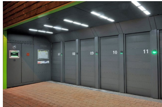
Radboxen mit geschlossenen Einstelltoren und Bedienterminal